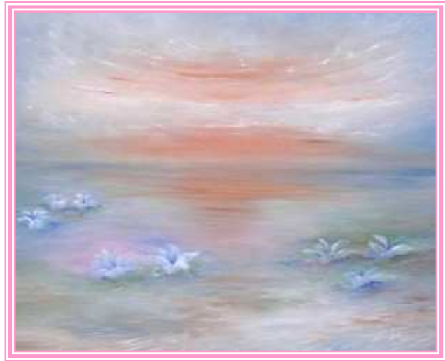
Il nuovo- Opera di Aurora Manfredi